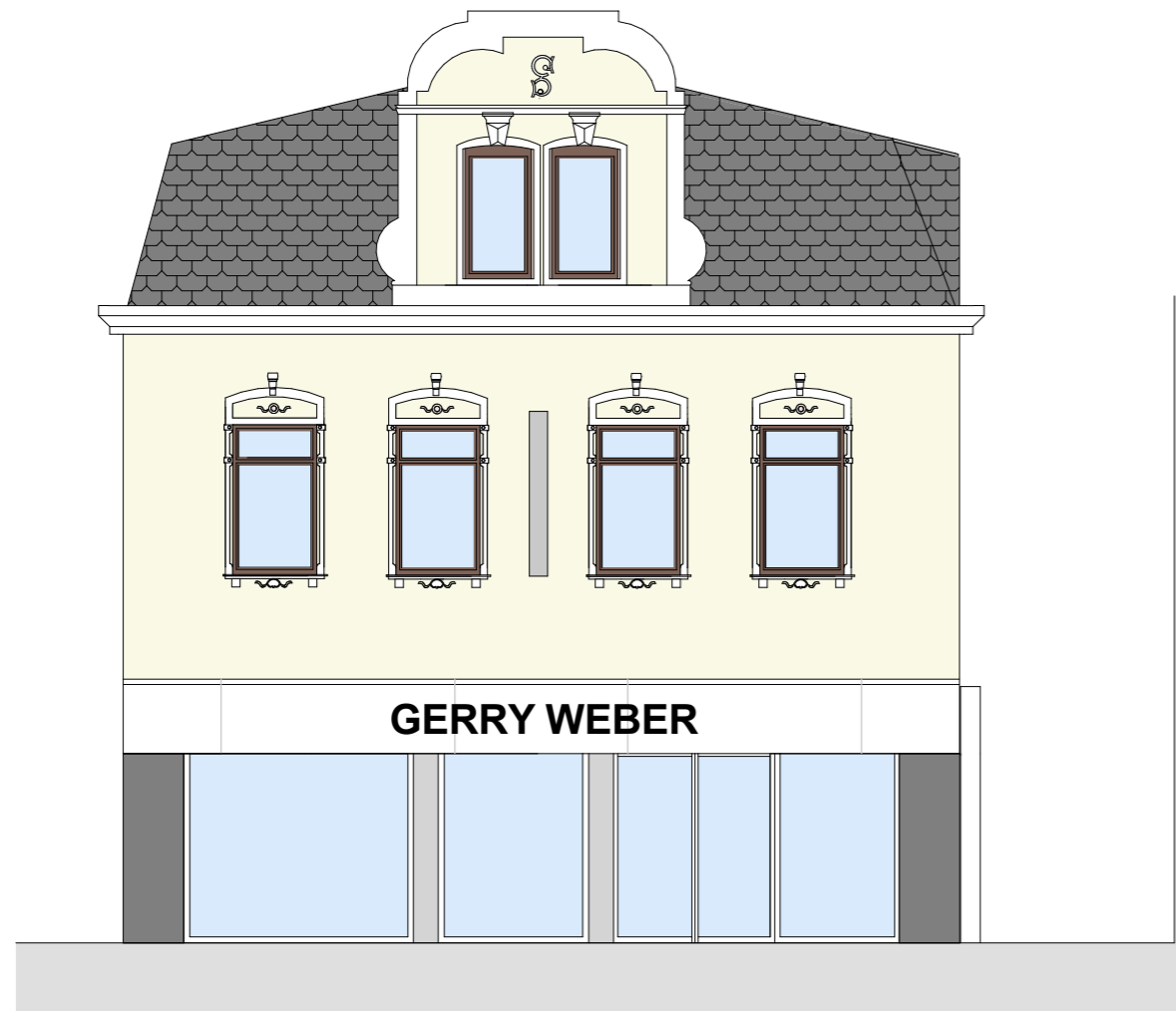
Ansicht Süd-West (Lange Straße)